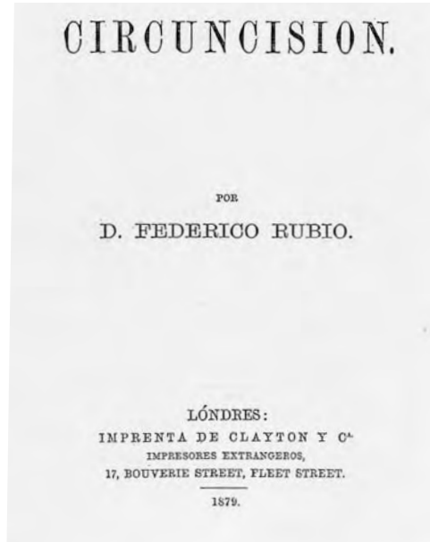
Figura 4: Estudio sobre la circuncisión de F. Rubio (Londres, 1879).