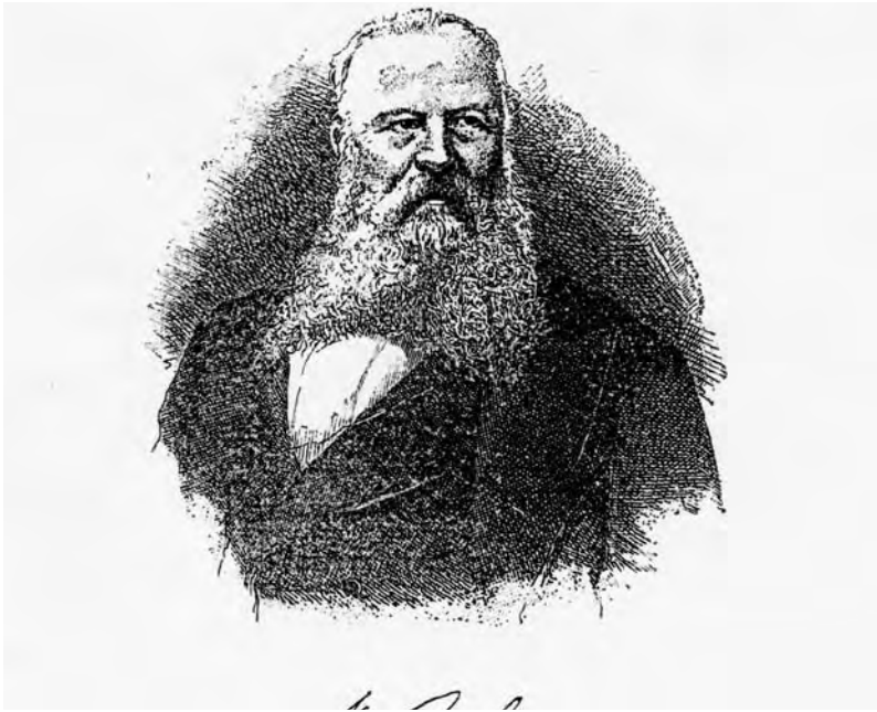
Figura 2: Retrato y firma de Federico Rubio y Gali ( Revista Médica de Sevilla , 1894).