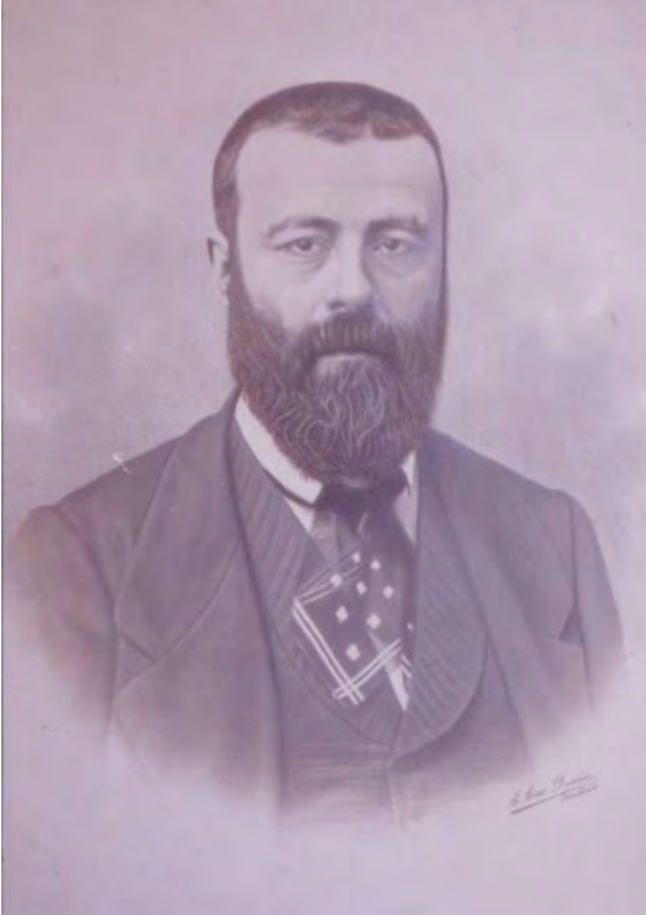
Figura 1: Retrato de Federico Rubio y Gali (Cedido por D. Federico Reixa Oreja).